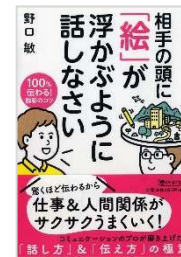
『相手の頭に「絵」が 浮かぶように話さない： 100%伝わる!説明のコツ』 野口敏著，PHP 研究所，2018.

将来、看護師になる私たちにとって、コミュニケーションスキルというものは必要不可欠なものといえるでしょう。医師の言葉を分かりやすく患者さんに伝えたり、患者さんの状態を分かりやすく医師に伝えたりと、「伝え方」つまり、「話し方」は看護師に求められるスキルの一部だと思います。