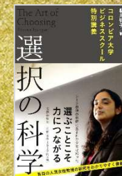
『選択の科学：コロンビア大学 ビジネススクール特別講義』 シーナ・アイエンガー著； 櫻井祐子訳，文藝春秋， 2010。

皆さんは、“ドラッカー”という人を知っていますか？ドラッカーは、経営学の神様とも呼ばれ、現在のマネジメントの考え方に大きな影響を及ぼしました。ドラッカーの代表作は「マネジメント」で、組織として成果を上げるための物事の味方、考え方、行動のエッセンスを解説しています。