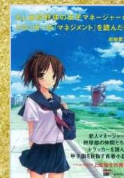
『もし高校野球の女子 マネージャーがドラッカーの 『マネジメント』を読んだら』