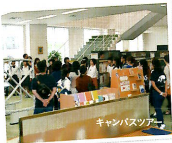
※詳しくはホームページをチェック！